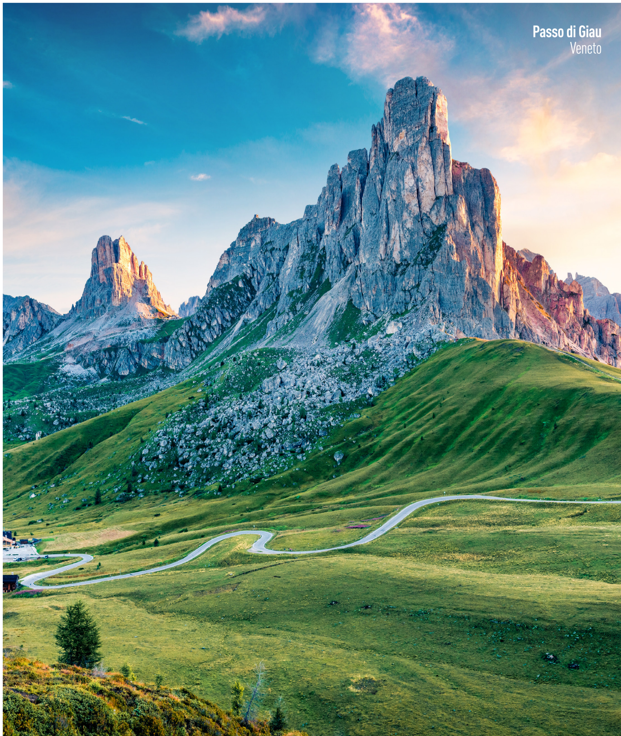
Passo di Giau Veneto